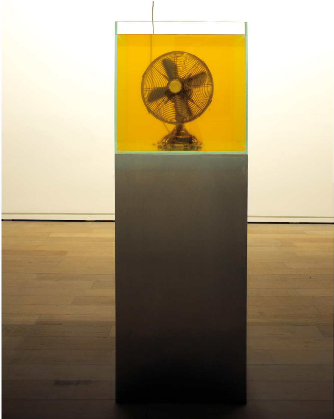
Atmosphère, 2015 Aquarium, oil, electric fan 尺寸不限