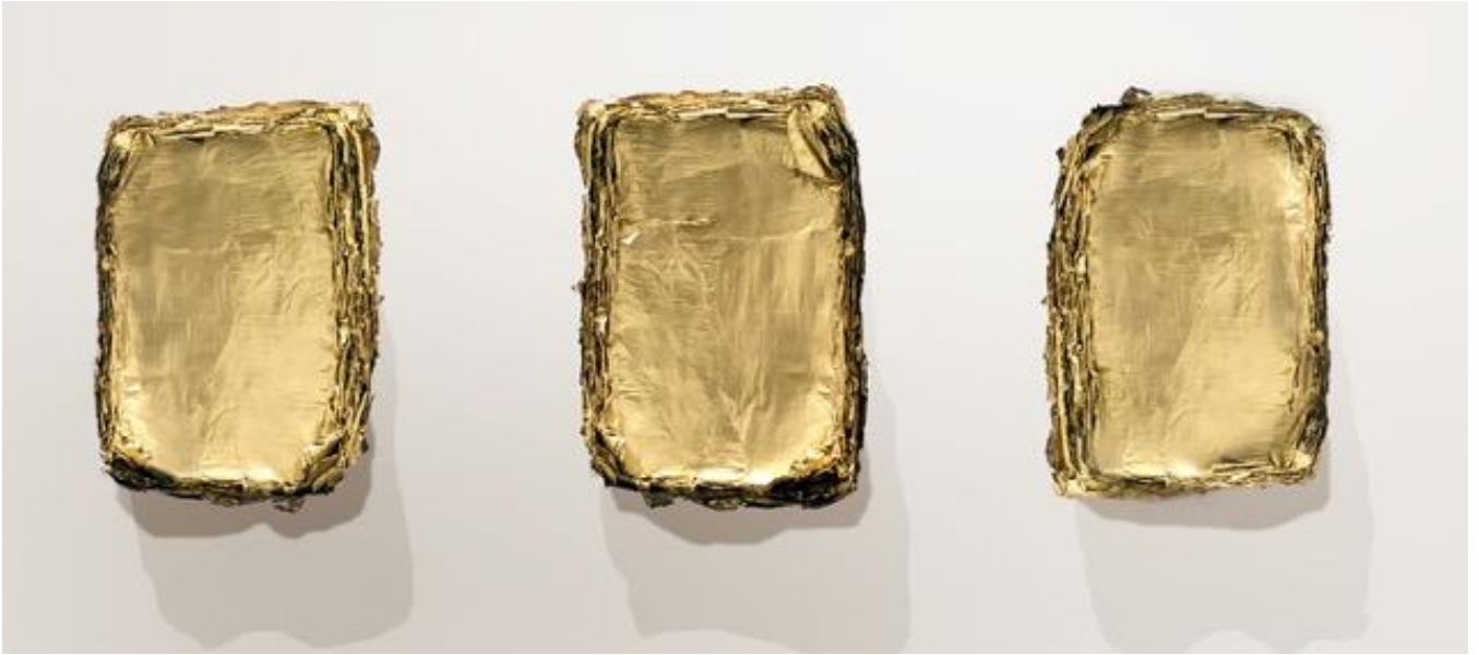
Concav, 2015 Paper, spray paint 尺寸不限