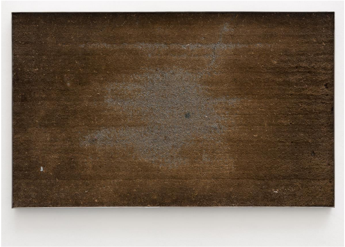
Paillason, 2015 Doormat, silicon, steel 尺寸不限