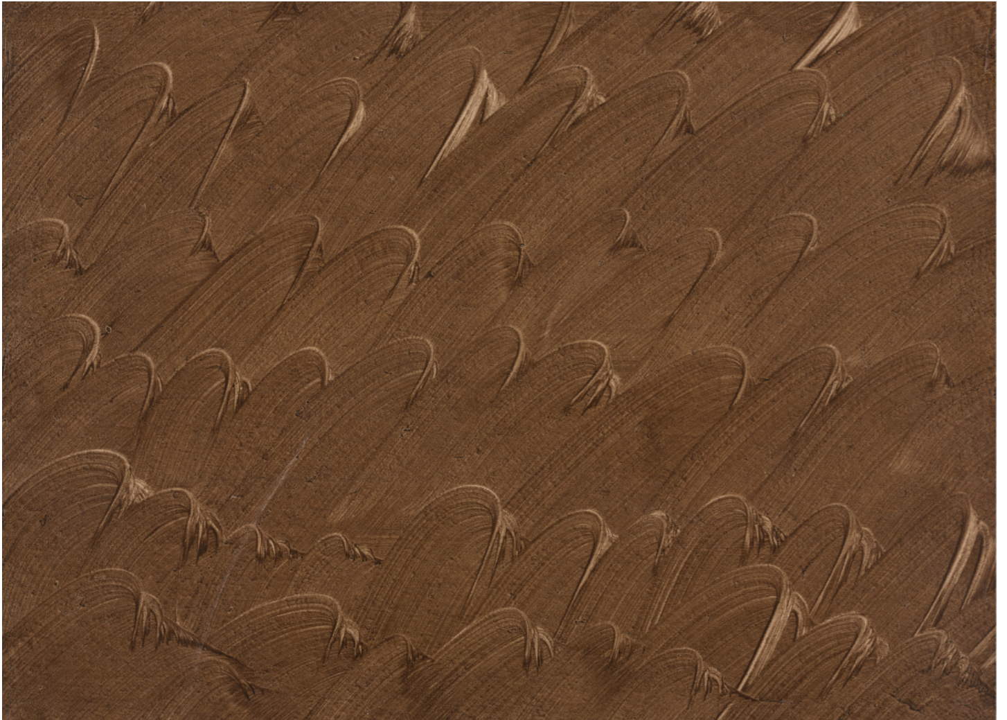
趙容翊 '80-622', 1980 丙烯酸樹脂, 畫紙 46 x 63.5 厘米