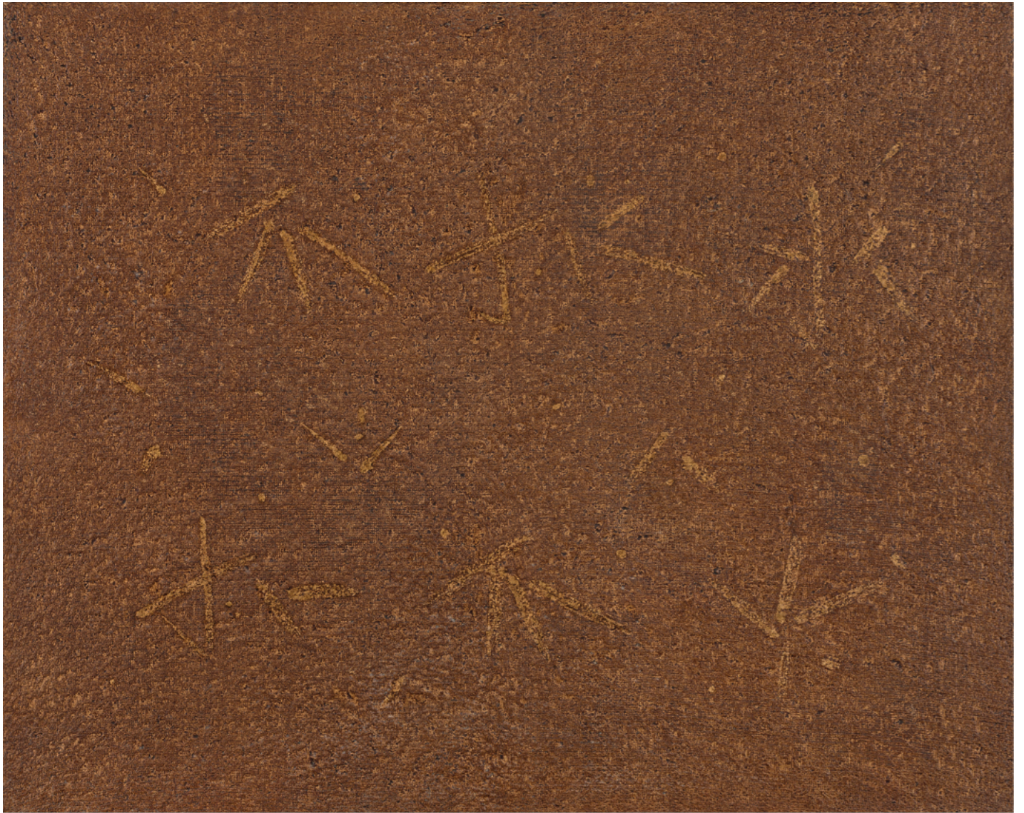
趙容翊 '96-706', 1996 丙烯酸樹脂, 畫布 130 x 162 厘米