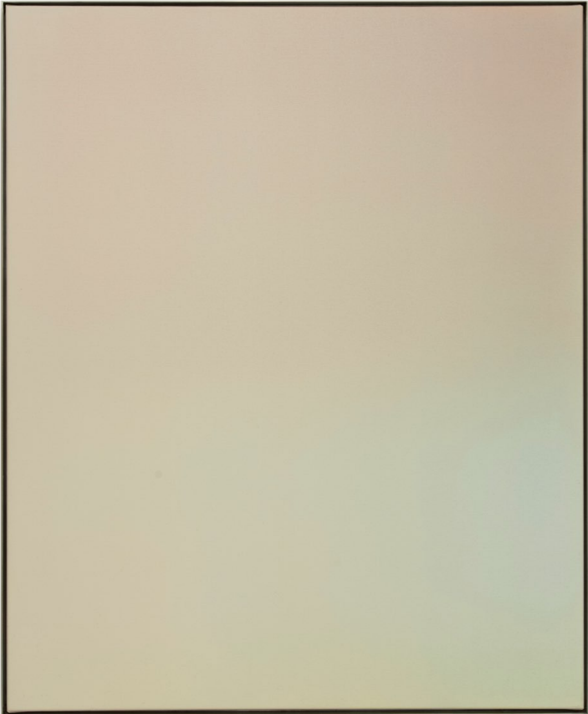
周育正,《電鍍金,保持冷靜,鍍鋁鋅版,祈禱,漸層,灰燼,抗議,不均,不滿,資本,香爐,倭存,激動,擊,日光。二》,2015 塑膠彩,畫布,78 x 3.5 x 94 公分