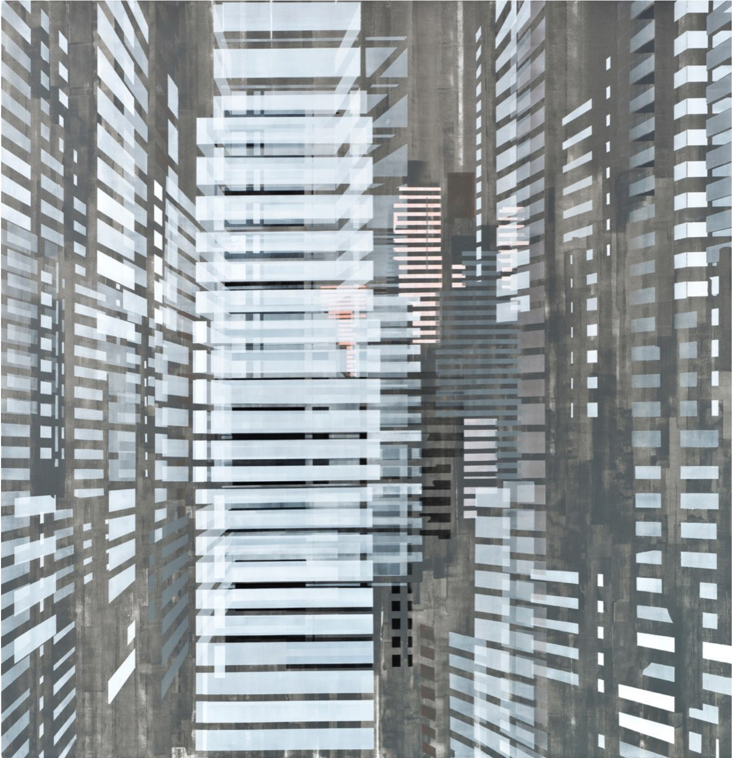
紐利·庫祖詹, 'Singularity', 2016 丙烯酸、畫布, 190 x 180 公分