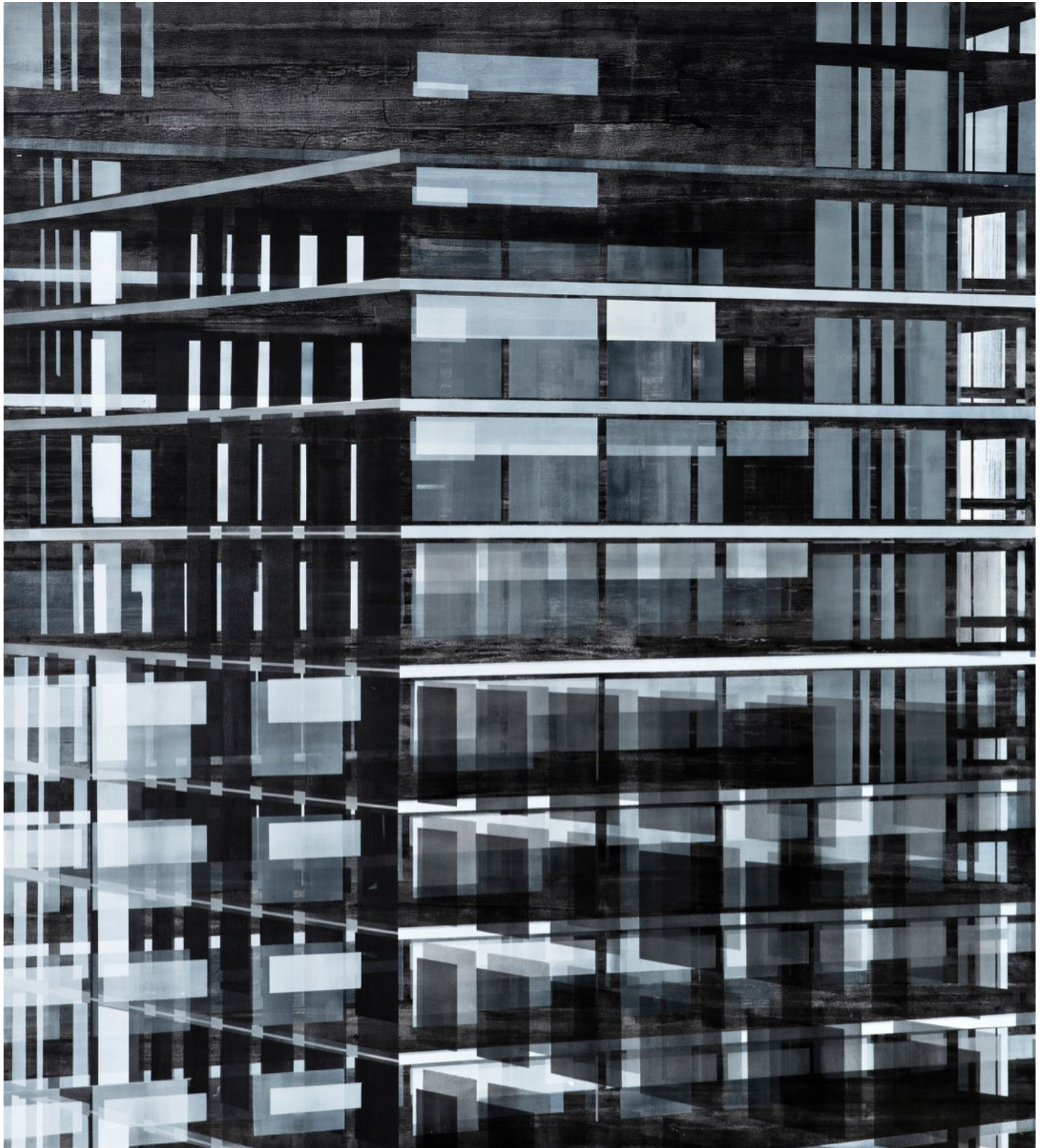
紐利·庫祖詹, 'The Loading and Reading of Density', 2016 丙烯酸、畫布, 185 x 165 公分