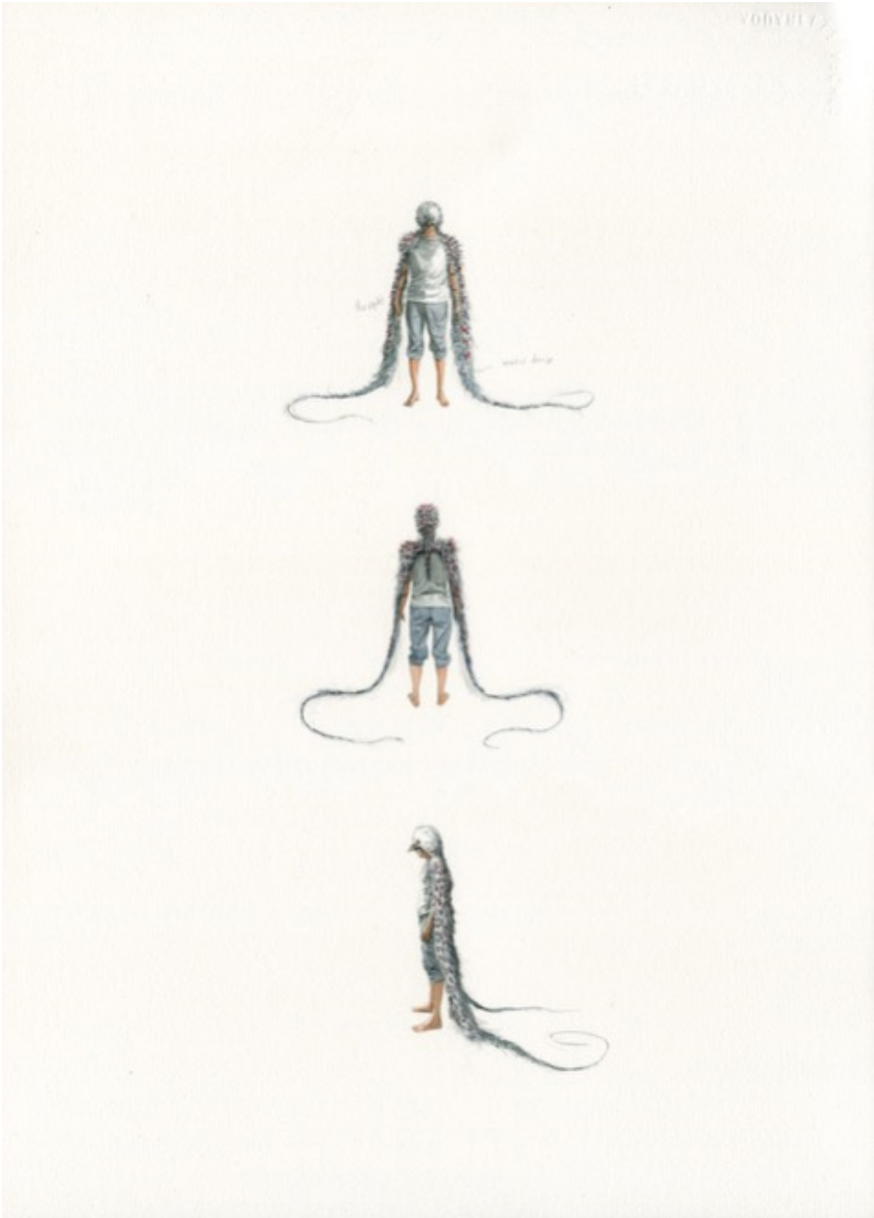
'Homme Volant 2', 2016 墨水, 水彩畫本, 42.5 x 30 公分