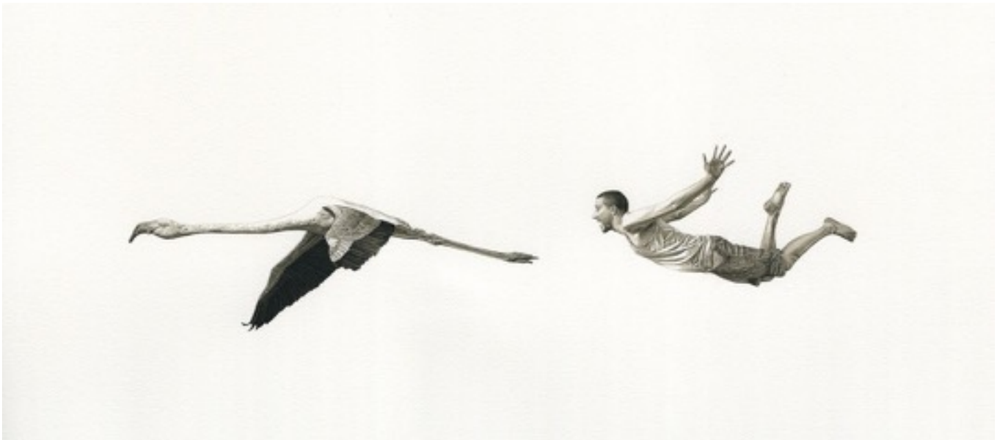
'Flamant Rose', 2016 墨水, 水彩畫本, 35 x 49.5 公分