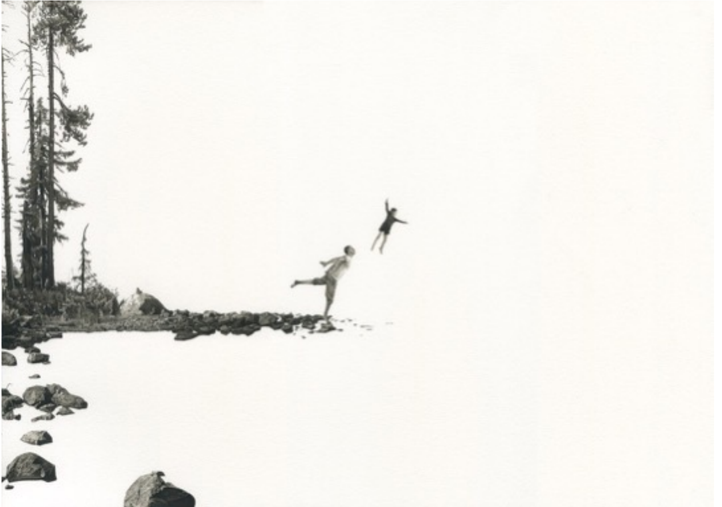
'Elle m'envole', 2016 墨水, 水彩畫本, 30 x 41.5 公分