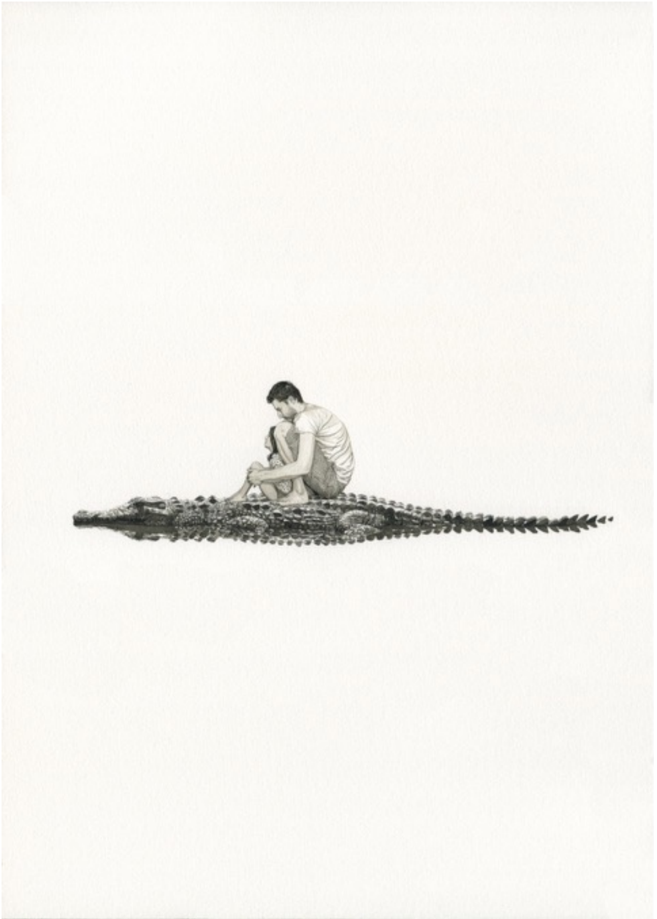
'Crocodile', 2016 墨水, 水彩畫本, 42 x 30 公分