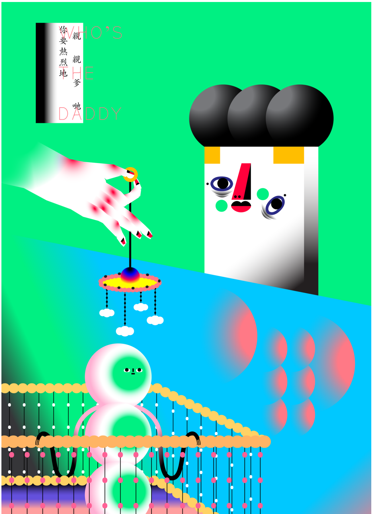
《你要熱烈地親親爹地》, 2017 單頻道動畫作品