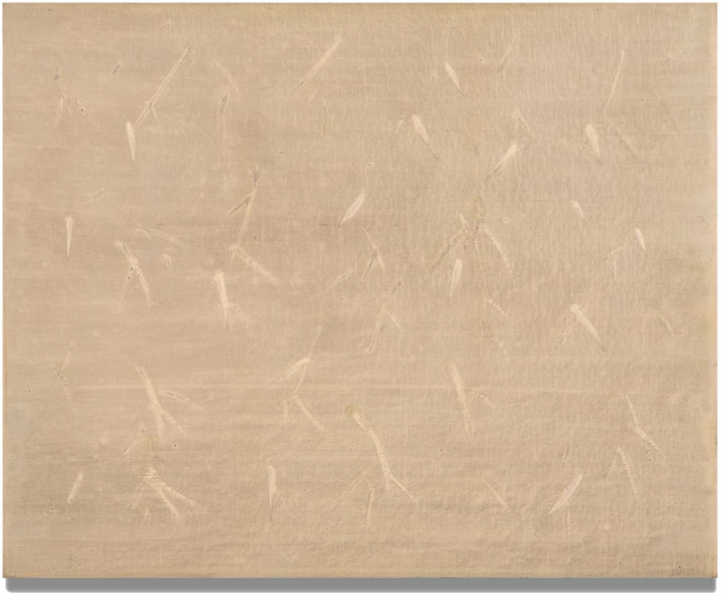
趙容翊, 《90-1112》, 1990 丙烯, 帆布