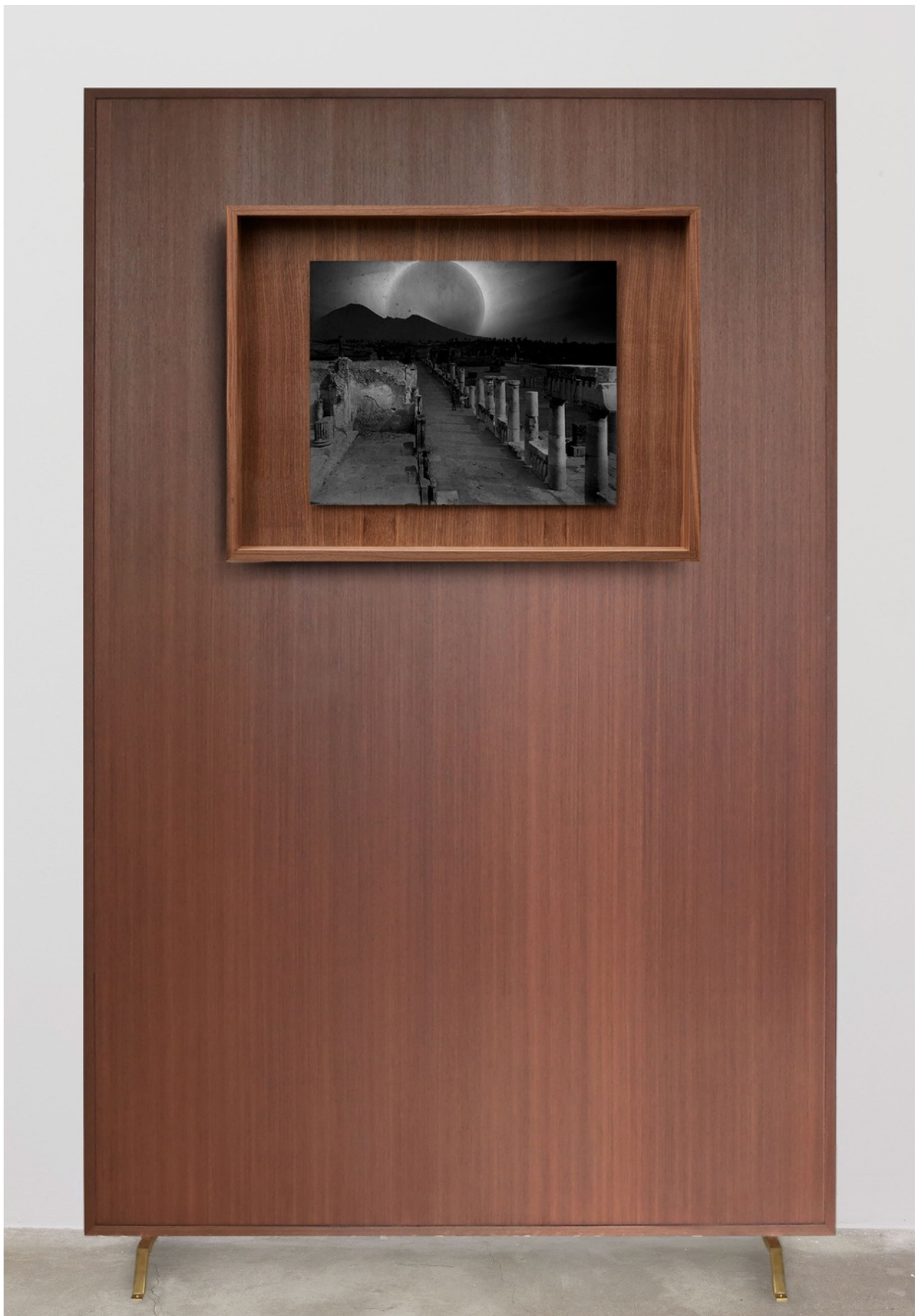
洛朗·格拉索, 《Soleil Noir in Pompeii 1817》, 2015 Fresson 印刷, 鋁, 核