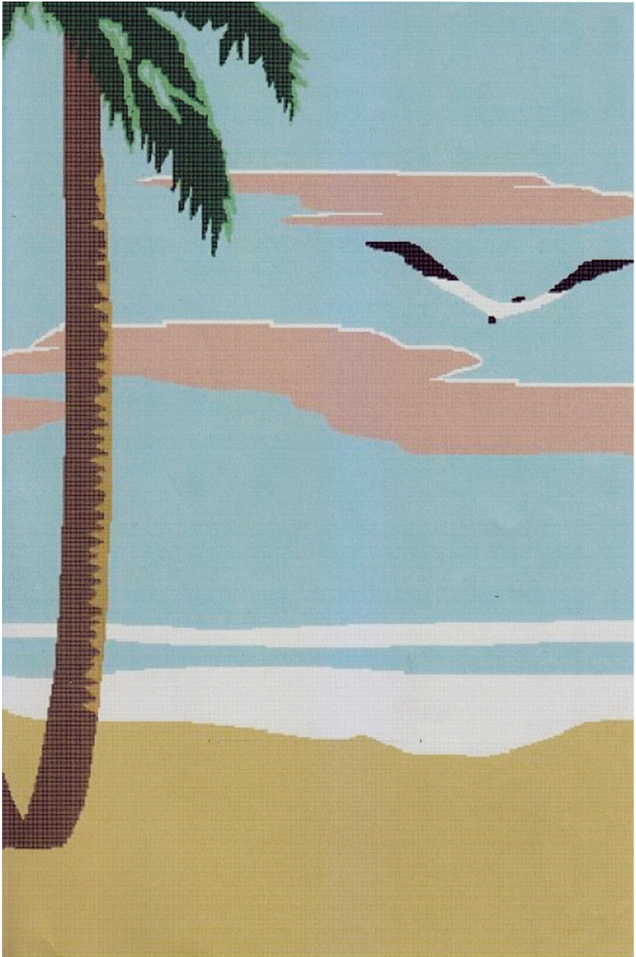
王衛, 《滑落的壁畫 2》, 2017 馬賽克瓷磚