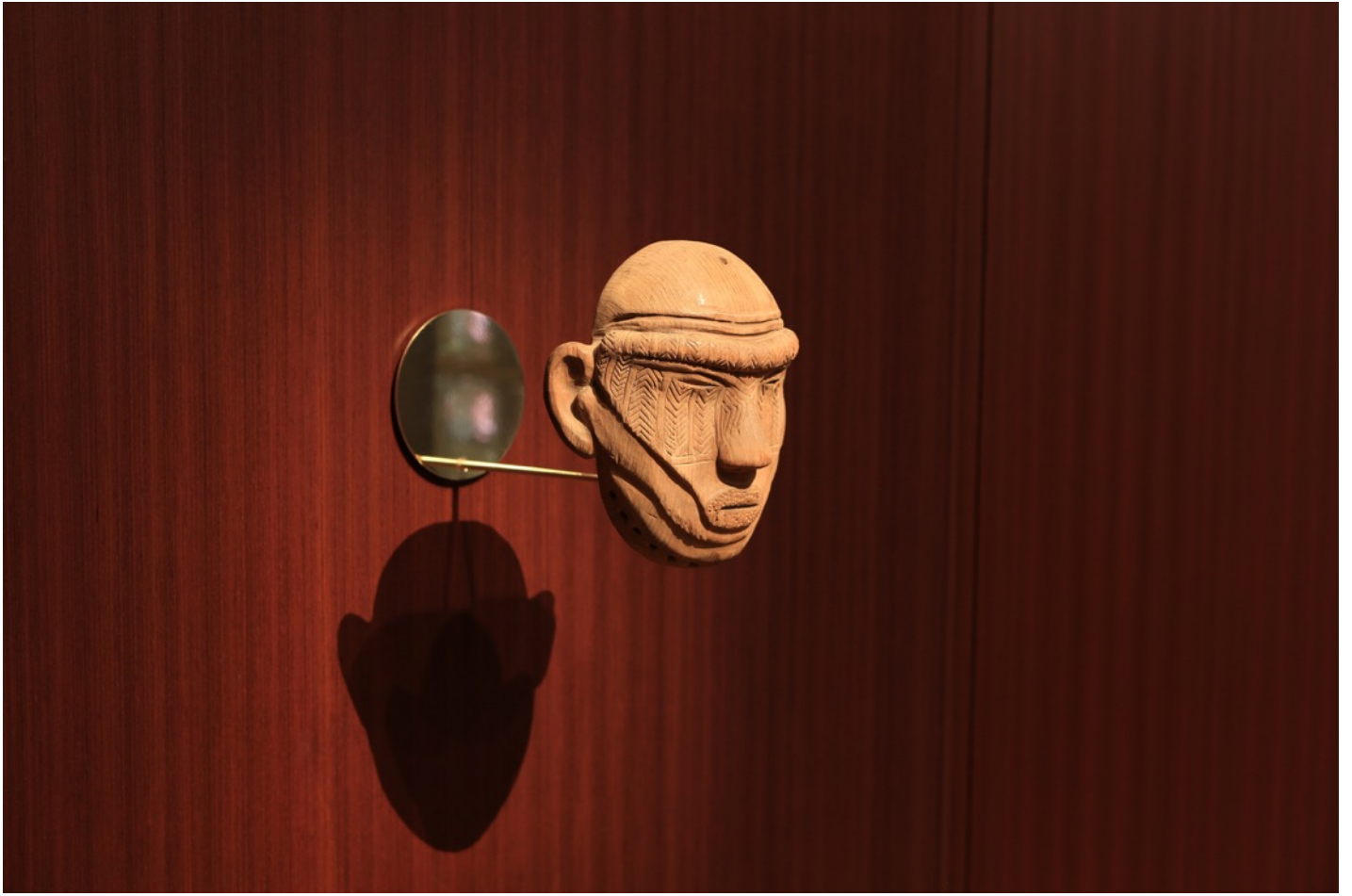
洛朗·格拉索, 《Behind the eyes》, 2015 木面具