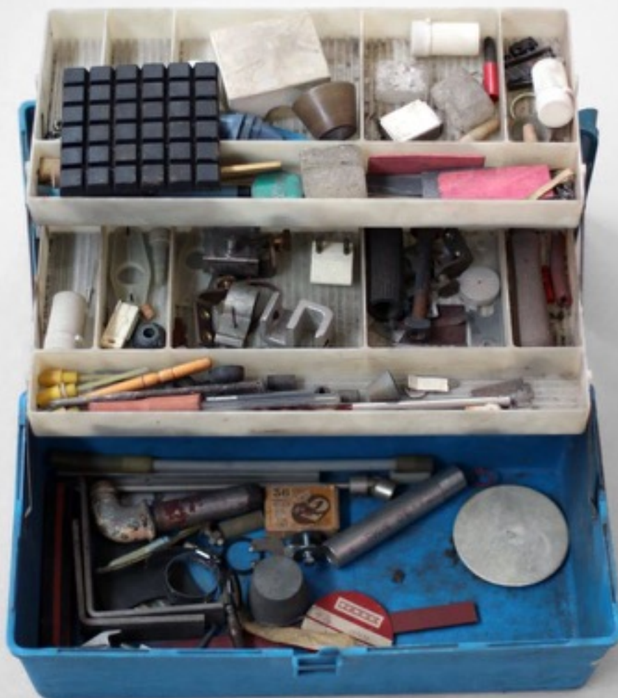
艾域克·柏達 《工具箱》(2016) 塑膠, 鋼, 其他工具 50 x 45 x 20厘米