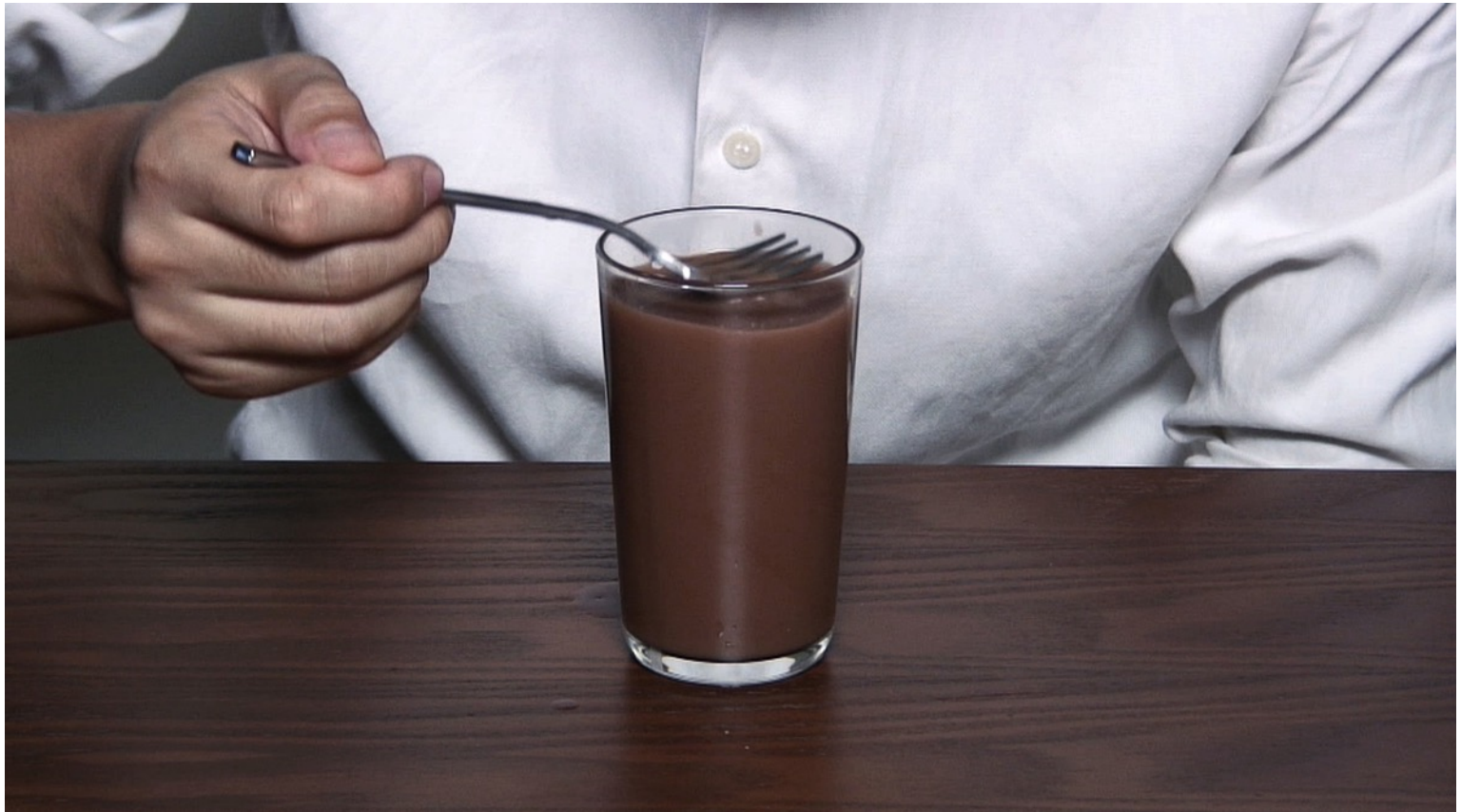
關尚智 圖片取自影像作品 《用叉子喝一杯熱巧克力》，2011 單頻道影片 28分9秒