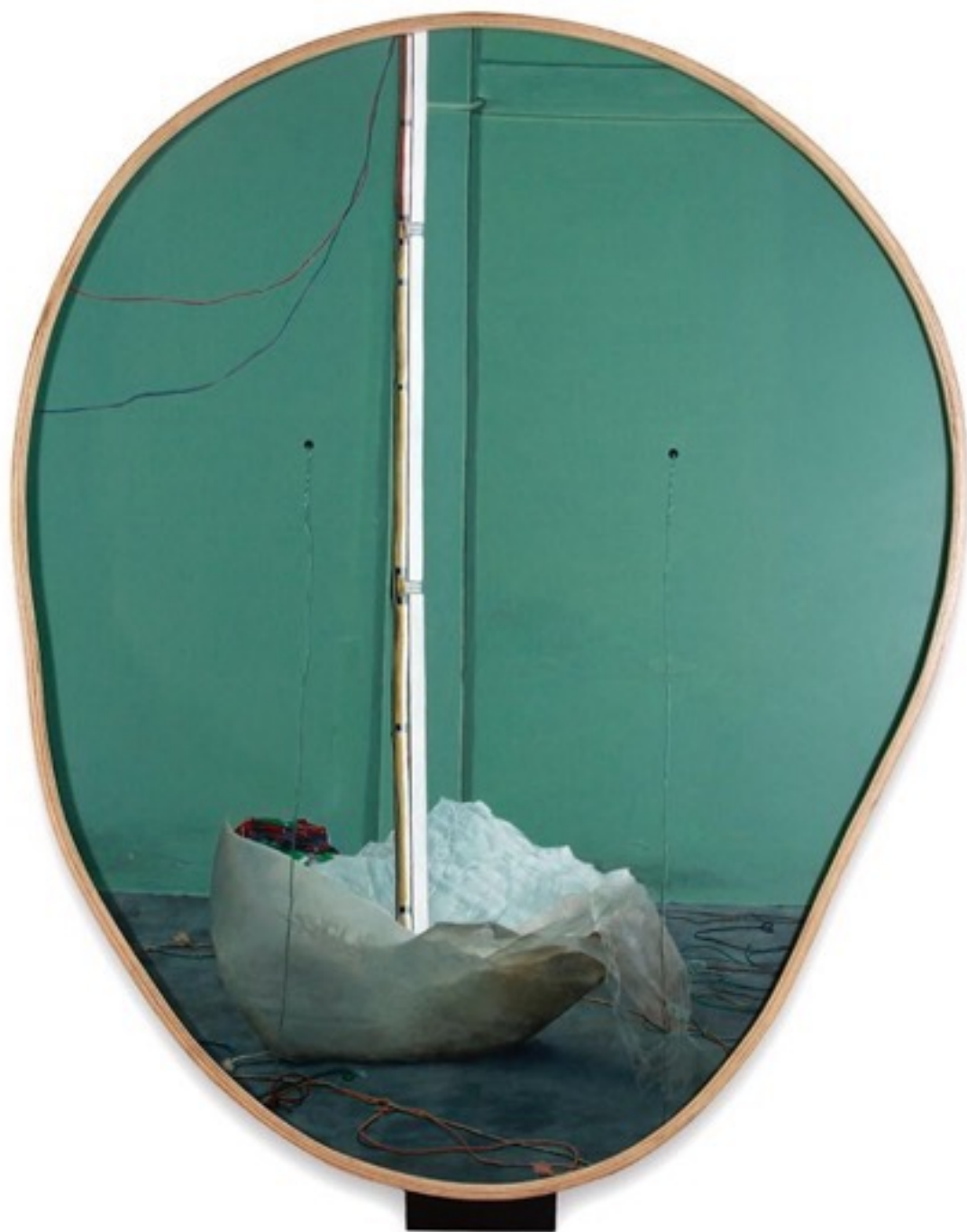
翰迪懷兒曼·薩普川 'Luardalam dan Tuturkarena', 2016 布面丙烯，玻璃櫃，霓虹燈 2件，每件220×180厘米，裝置