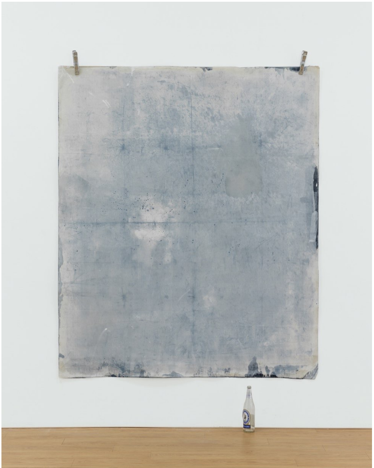
傑里米·埃弗雷特 '自動曝光 # 1 (鴨脷洲)', 2015 藍印, 帆布 196x166公分