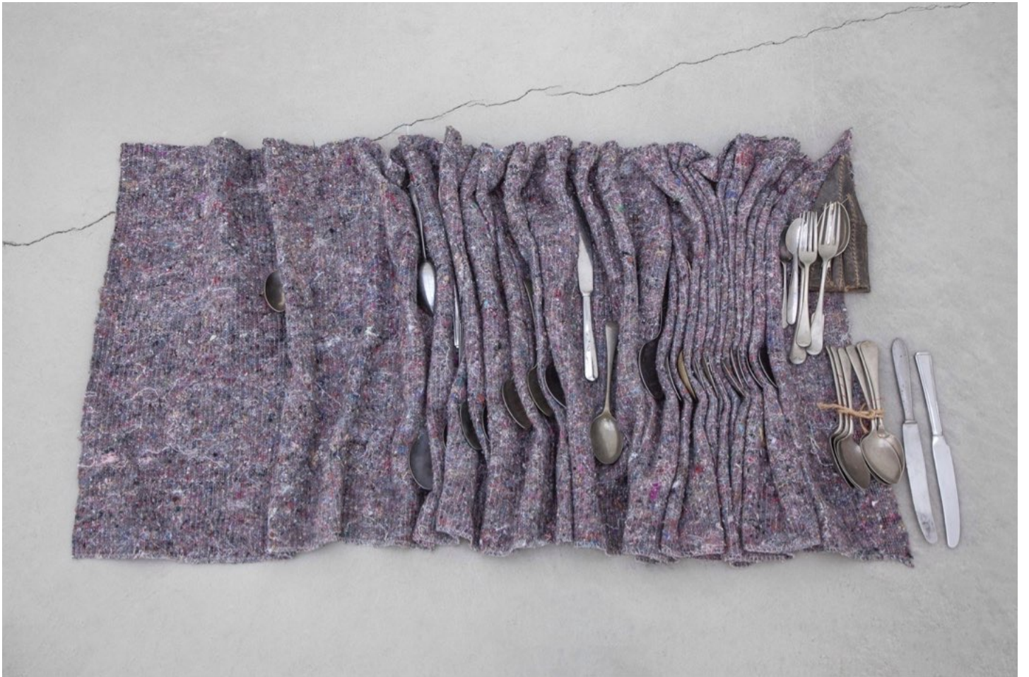
菲利普·賴 'Skin and bones', 2014 餐具，中轉毯，線，繩，皮革 5.5x84x51公分